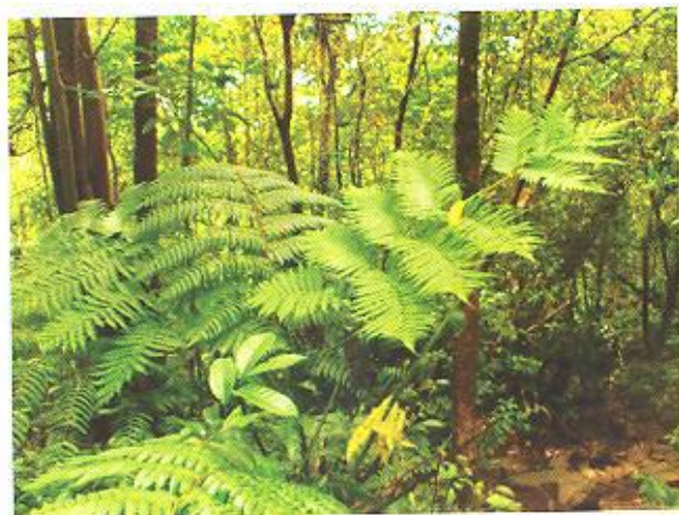
Bosque nublado, Cachote.

Cachote es un paraíso para los observadores de aves, reconocido internacionalmente. Se han reportado más de 30 especies de aves, muchas de ellas necesitan el bosque para su supervivencia. Para mejor identificar las aves es recomendable llevar binoculares y una guía de campo.